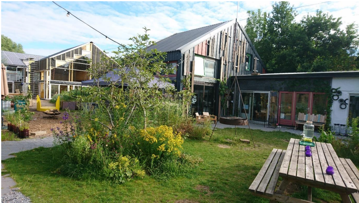
Foto: Hof van Cartesius, één van de beeldbepalende locaties in Werkspoorkwartier

Het project 'Werkspoorkwartier: Creatief Circulair Maakgebied' is mogelijk dankzij een subsidie van het Europees Fonds voor Regionale Ontwikkeling (EFRO) Kansen voor West II, dat gericht is op het versterken van de regionale concurrentiekracht en het vergroten van de werkgelegenheid.